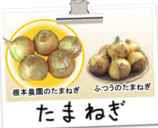
根本農園のたまねぎ